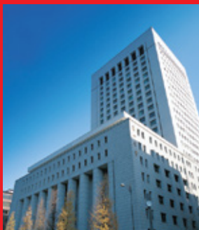
Tòa nhà trụ sở Dai-ichi Life Holdings tại Tokyo, Nhật Bản